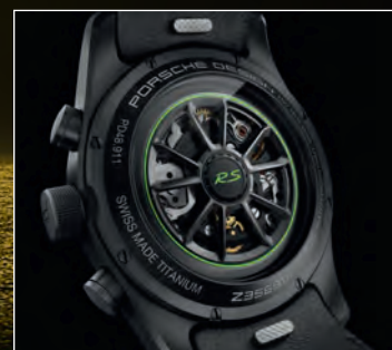
Satin black with Lizard Green wheel rim V05