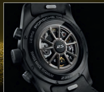
Satin platinum V03