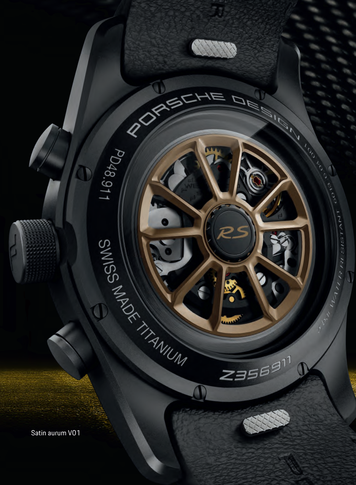
Satin aurum V01